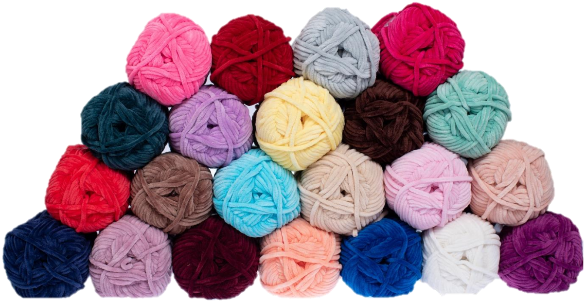
ELIAN Soft Kitty